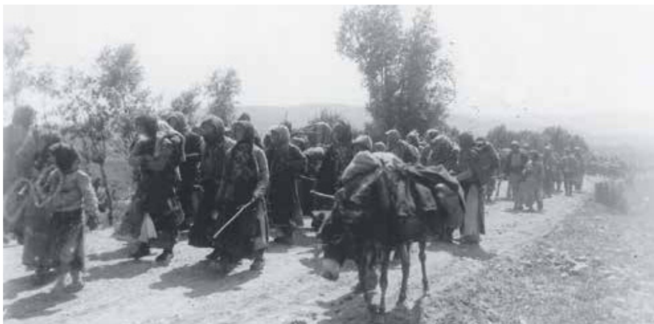
Julio 1915, deportación de la población armenia de Erzerum

Cuando uno lee las leyes penitenciarias de nuestra región, da la impresión que lo escribieron alucinado. Sí, para la resocialización, reinserción, repersonalización, hay una resubjetivación. El que entra diciendo “si lo robé” sale diciendo “soy ladrón” se resubjetiviza perfecto, asume el rol desviado. Con eso se lo larga de nuevo, con un certificado de incapa-