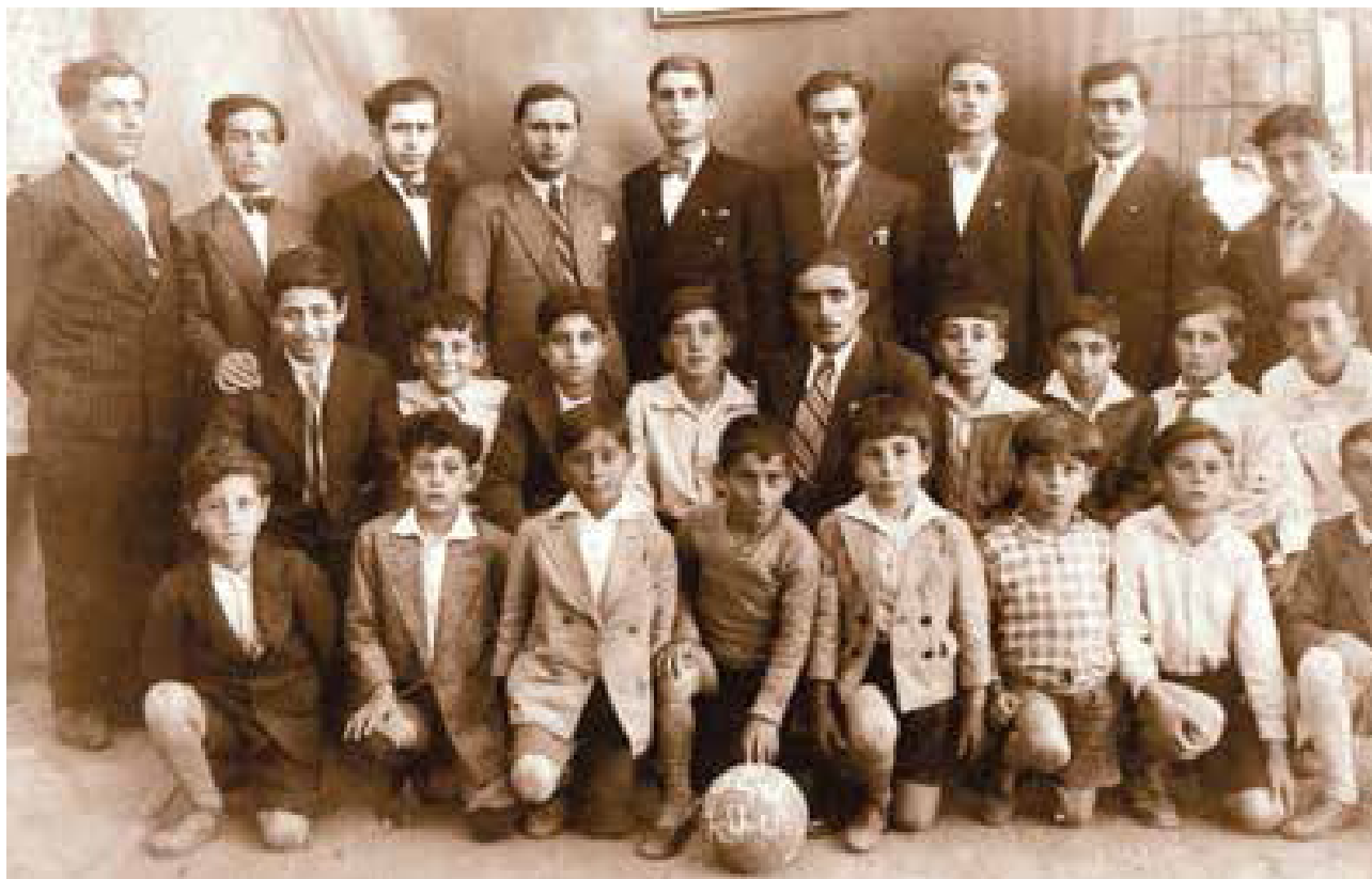
Unión General Armenia de Cultura Física. Grupo de niños de Valentin Alsina (Año Circa 1935)

Quienes tenemos cierta experiencia, sabemos qué es lo que ha pasado en este país, así es que tenemos la responsabilidad de que no tan solo hay que tener memoria, sino tener