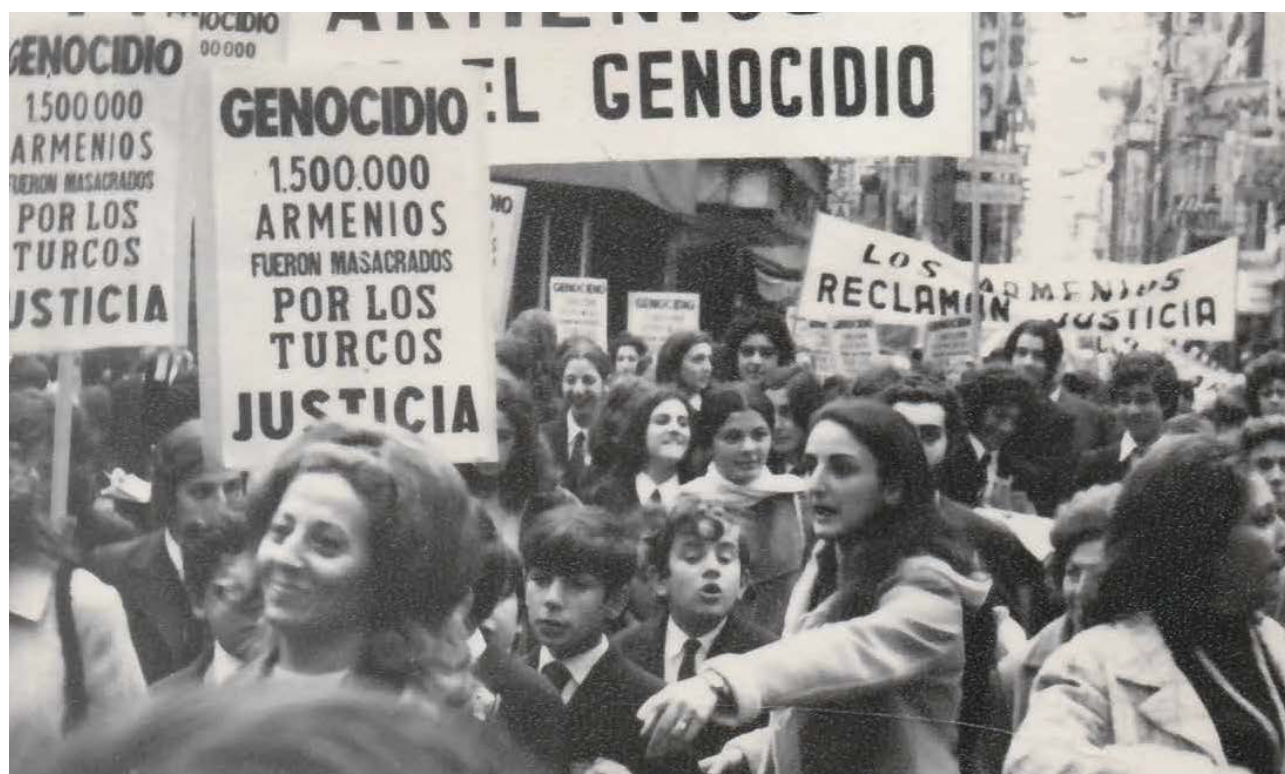
Desde el año 1965 se desplegaron una serie de movilizaciones de las comunidades armenias en la diáspora reclamando el reconocimiento del Genocidio Armenio. En Argentina durante los años setenta hubo varias movilizaciones en las ciudades de Córdoba y Buenos Aires. Esta foto fue tomada en la Ciudad de Buenos Aires, en la calle Florida, en 1973.