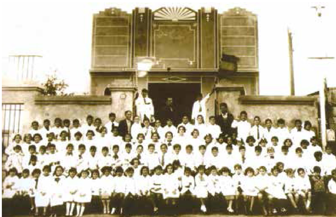
Estudiantes de la escuela Jrimian con las banderas de Argentina y Armenia. 1936

Nos tenemos que encontrar, tenemos que conversar, tenemos que mirarnos a la cara, como dice Adolfo Pérez Esquivel, saber quiénes somos, compartimos esta gloriosa lucha contra del uno en este sistema binario terrible, donde el uno nos oprime. Para mí, puede ser el patriarcado, para otros, el sistema capitalista, para otros, una oligarquía, pero es la