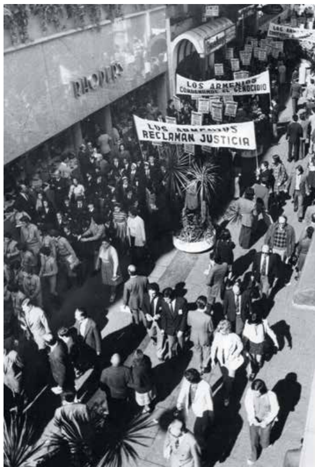
Movilización en la calle 9 de Julio, ciudad de Córdoba, años 70.