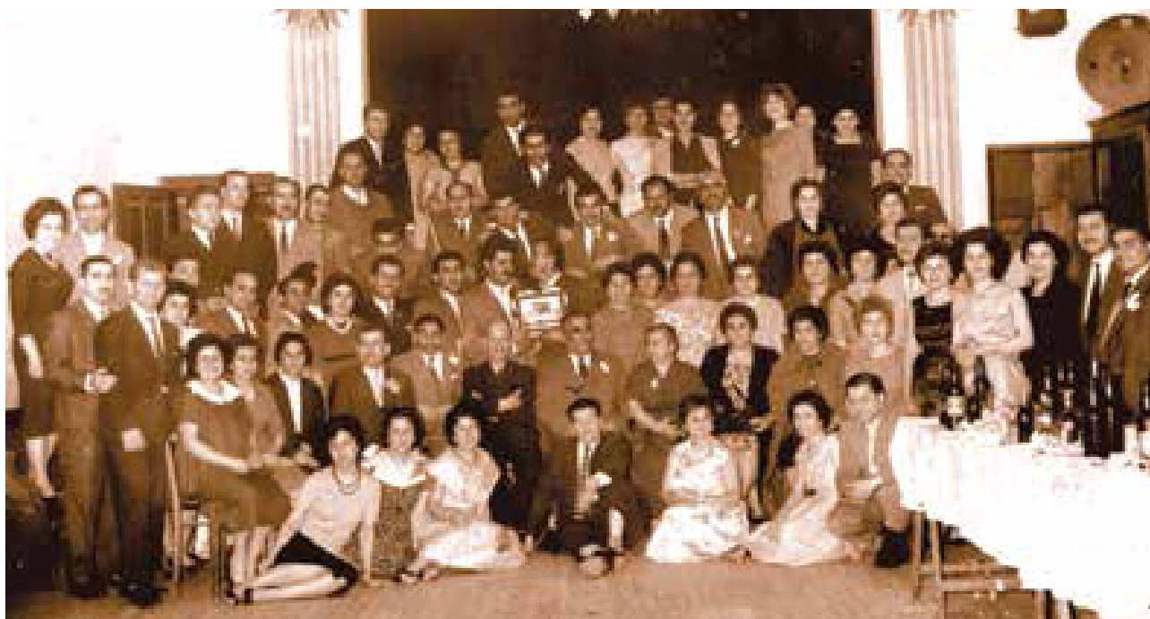
Reunión organizada por la Sociedad de Beneficencia HOM (Actualmente llamada Asociación Civil de Beneficencia para América del Sur) durante la visita a la Argentina de Simón Vratzian (Último Primer Ministro de la República de Armenia de 1918) Año 1957.

Nos tenemos que juntar, tenemos que ser capaces de conversar, aunque tengamos posiciones encontradas, no importa, pero no queremos esta supremacía del uno porque nos están aplastando y tenemos que ser más inteligentes. No nos dividamos, los que estamos de acuerdo, tratemos de unificarnos en una propuesta que nos integre de alguna manera. Todos sabemos que vamos a perder algo, pero lo que vamos a ganar es muchísimo. Muchísimas gracias a todos ustedes.