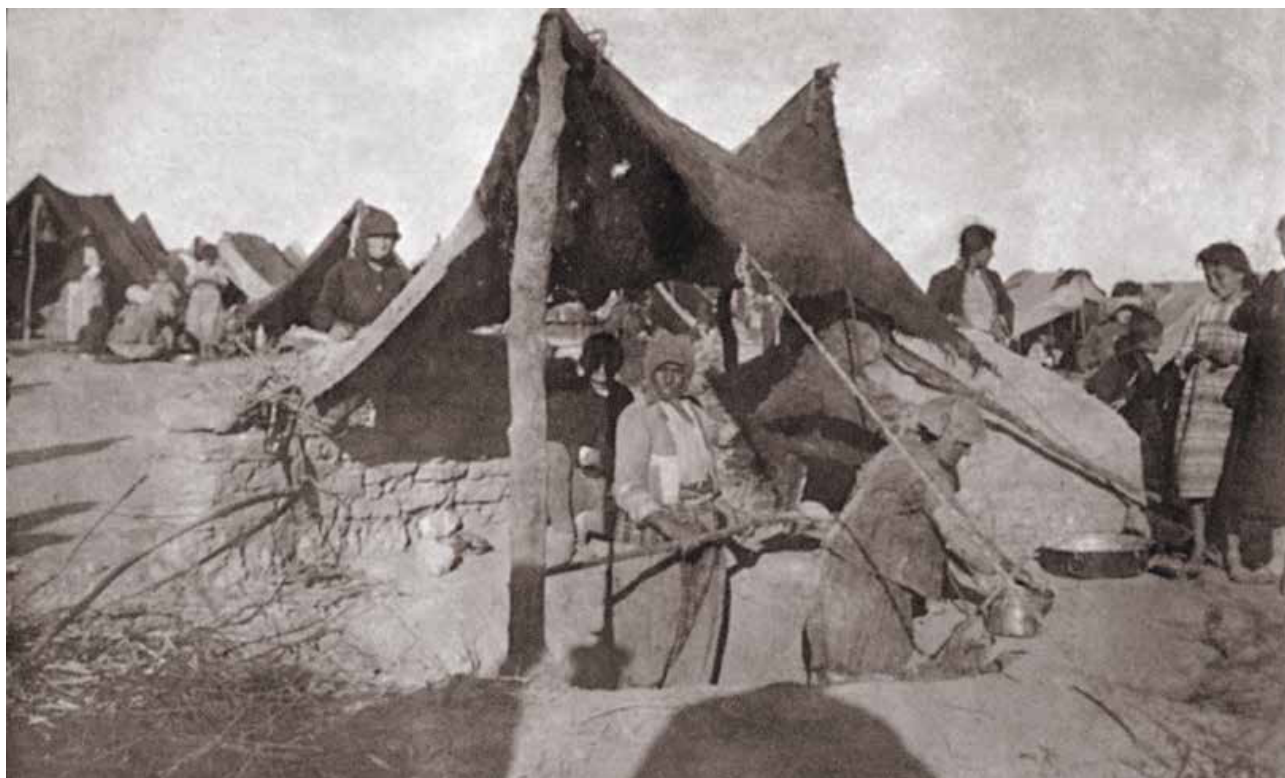
Campo de deportados en Rakka - Siria

Mientras nosotros estamos acá, Armenia tiene presos, soldados presos, tiene fusilamientos, tiene tormentos. Azerbaiyán plantea que viene a terminar lo que sus antepasados no pudieron. Nuevamente debemos unirnos para pronunciarnos, para luchar por un