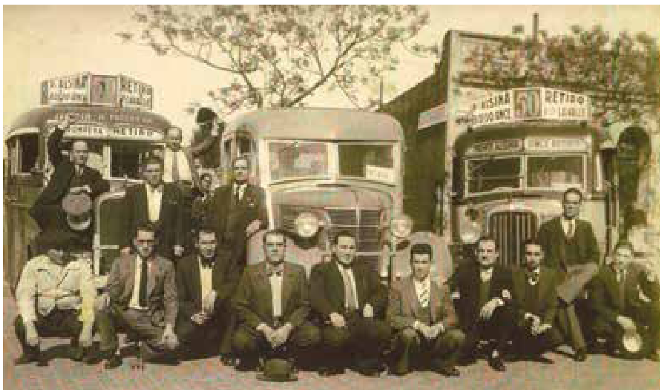
Colectivos de la Línea 50.1930.

La verdad es que independientemente de la fecha, encontrarnos hoy me pareció hermoso, y el testimonio y el valor de esa nieta de armenios, orgullosa de su historia, de la lucha de su familia, de lo que significa ese granito de arena en la memoria, me da espe-