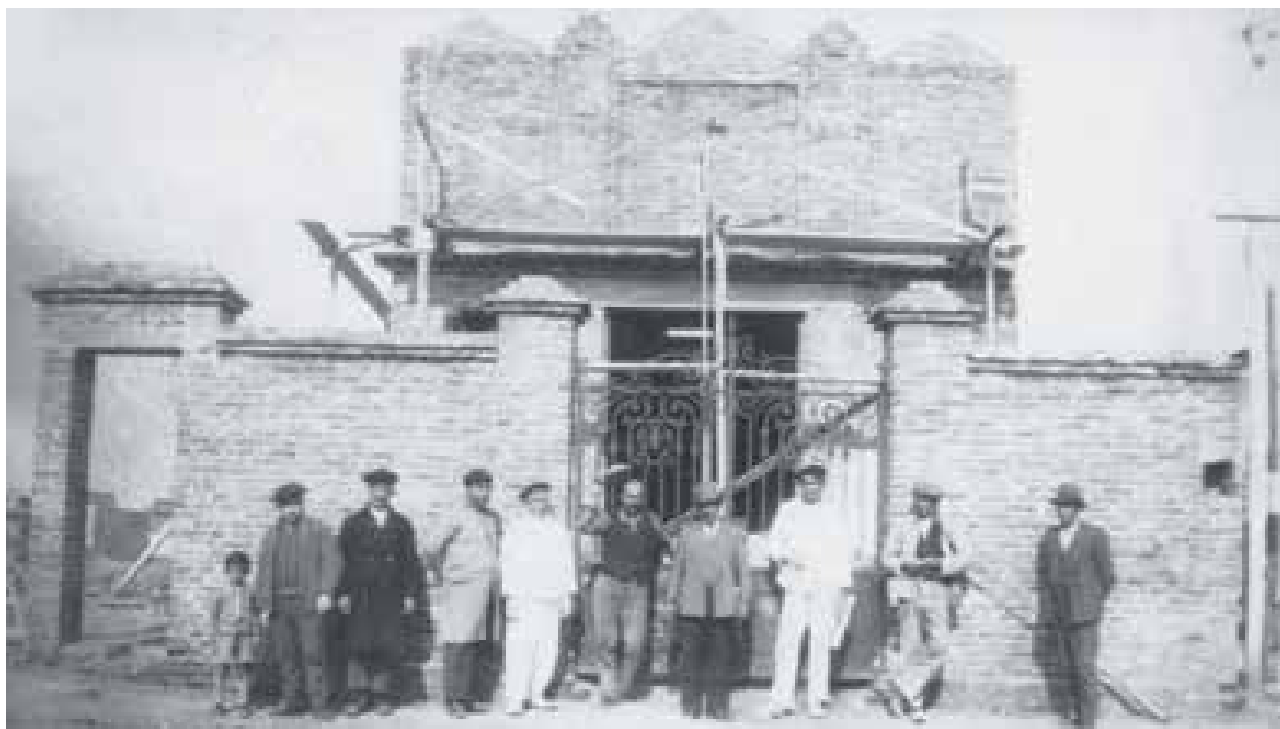
Construcción de la Escuela armenia Jrimian. Valentín Alsina, Buenos Aires. 1936

Para ir cerrando; la memoria por el Genocidio Armenio, la necesidad de seguir luchando por justicia, por seguir reclamándola que nos atañe como armenios, como miembro de