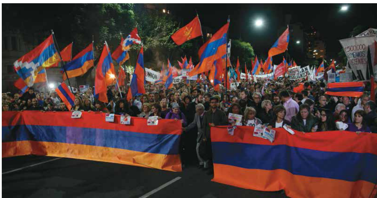
Marcha organizada por organizaciones juveniles armenias, Buenos Aires, Abril de 2015

Seguiremos trabajando con toda nuestra energía y convicción y les agradecemos la presencia y participación. ♦