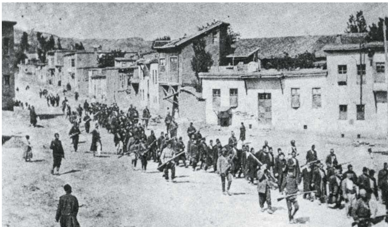
Deportación de la población armenia de la ciudad de Jarpert (1915)

Los que necesitamos hacernos de esas palabras, de esos recuerdos que quisieron destruir, para seguir reconstruyendo nuestro presente. Principalmente pensando en el futuro. Yo hoy hoy a la mañana compartía un encuentro con chicas y chicos, niñas y niños de la primaria, en el marco de trabajar los cuarenta años de la Democracia. Pensaba en el genocidio en la Argentina y en charlar sobre el testimonio que de quienes militamos la memoria. Muchas veces ponemos como un bien común para poder encontrarnos, como una excusa si se quiere para encontrarnos y pensar juntos y juntas esta historia. La verdad es que me impactó mucho, me viene pasando después de haber contado la historia. Estuvimos más de dos horas y la verdad es que las preguntas siempre son muy lindas, pues las